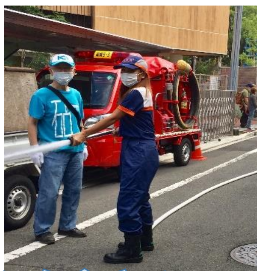
D型可搬式ポンプの筒先を操作