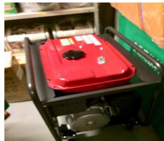
水をろ過する機械