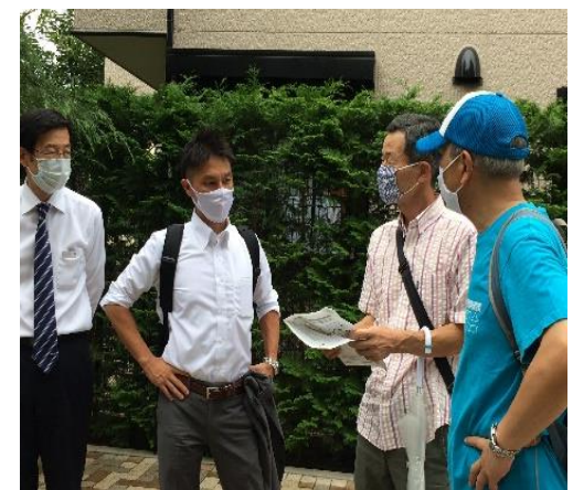
設備について丁寧に説明していただきました