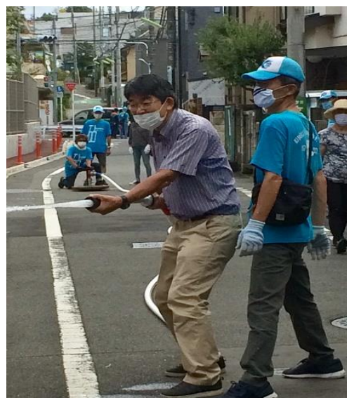
砧まちづくりセンター大橋所長も体験

これに対し「D型可搬式ポンプ」は町会役員がデモンストレーションしました。モーターの力が加わり、水圧もすごいです。筒先を持った方は、あまりの水圧にびっくりしていました。もしものときに備えて、皆さんもぜひ実習会にお出かけください。